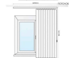
Замер ниже подоконника

Ширина карниза вертикальных жалюзи = ширина проема +10 см с каждой стороны