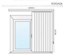
Замер до подоконника

Ширина карниза вертикальных жалюзи = ширина проема +10 см с каждой стороны