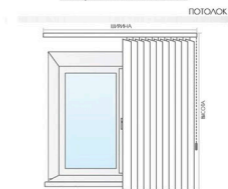
Замер ниже подоконника

Ширина карниза вертикальных жалюзи = ширина проема +10 см с каждой стороны